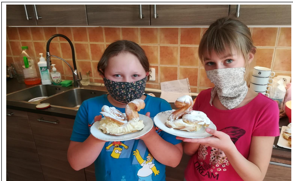
Kroužek vaření, spolupráce s odborníkem ŠABLONY II

V prvním pololetí probíhaly akce beze změn, ale druhé pololetí bylo taktéž velmi ovlivněno současnou nepříznivou situací a většina akcí nemohla proběhnout.