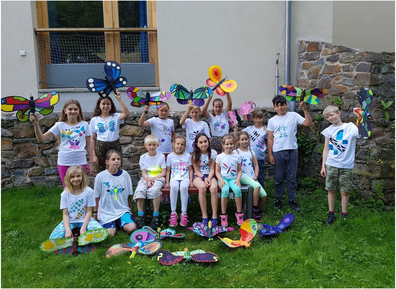
Výtvarný příměstský tábor